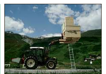
In seveser dat ei cun la scantschella da muntogna da Com&Com.