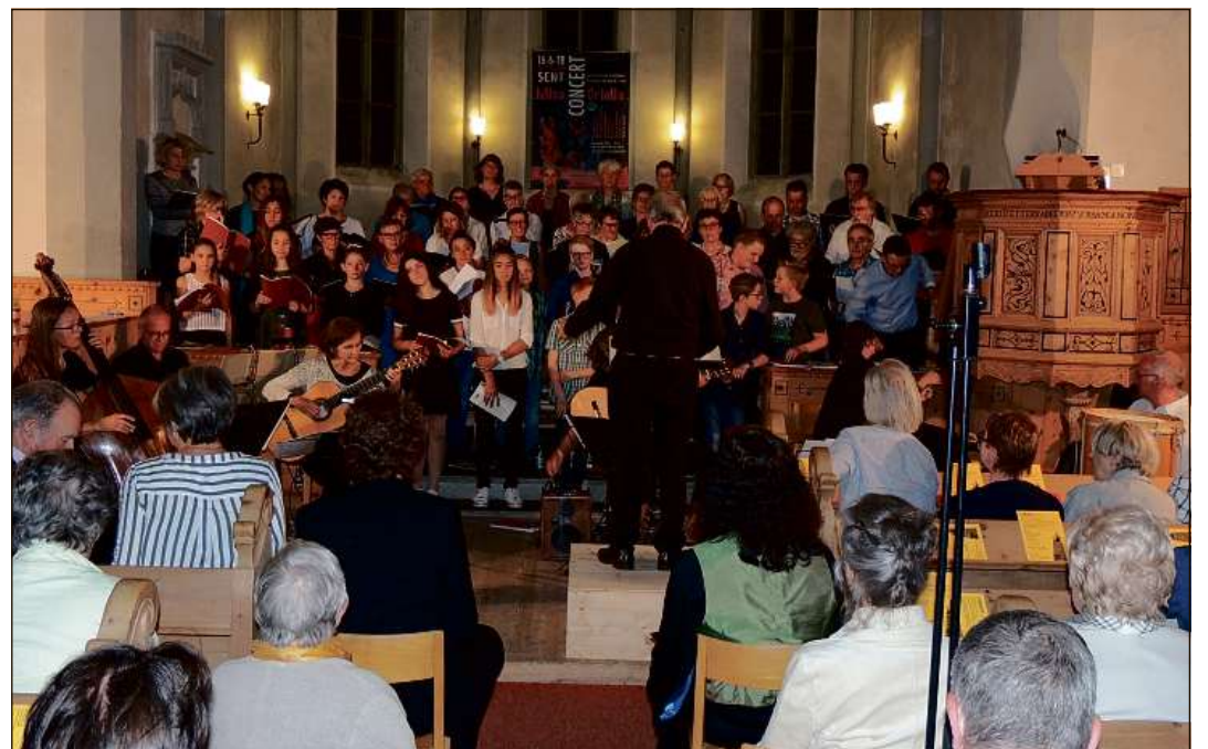
Il cor culs uffants, instrumentalists e solists ha satisfat plainamaing.