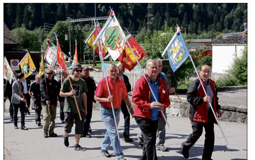
Ils tiradurs sursilvans selegnan dalla Fiasta da tir cantunala en lur regiun.