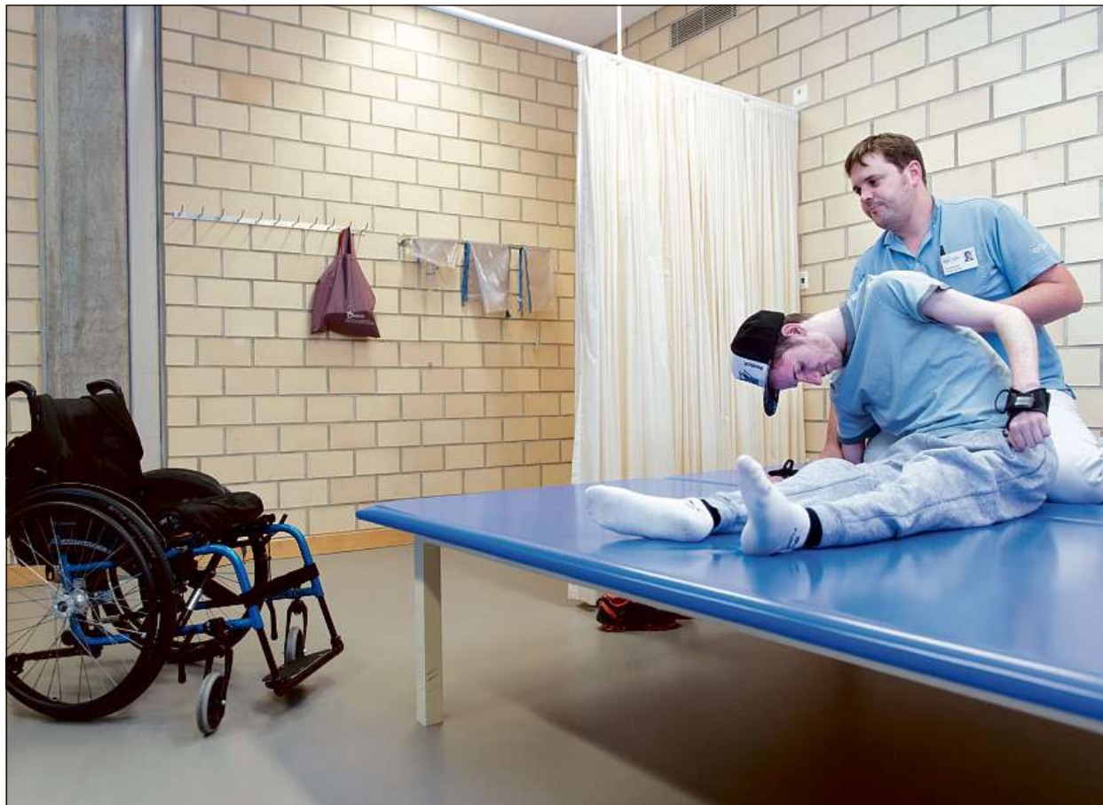
Ils 1,8 milliuns commembers genereschan la summa da 68,4 milliuns per la Fundaziun svizra da paraplegia e Nottwil.

Igl onn vargau han ins saviu dar a 10 191 visitaders in'investa ella clinica speciala. Dils indrezs e stabiliments da sport el Center da paraplegia han