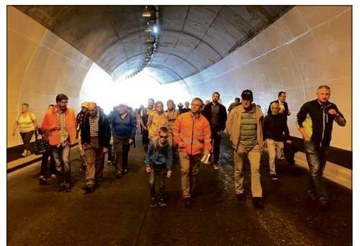
Per l'emprima giada tras il tunnel.

Chasa Grischa per in sviament. Stgars duas emnas avant ch'il sviament vegn surdà al traffic da transit ha la populaziun pudì prender en egl il fabricat. Tut para gia ussa dad esser pront. Mo pli pitschnas lavurs en da finir fin tar il grond mument. Il di nua ch'il sviament vegn surdà al traffic. Quai capita ils 28 da zercladur. La gronda festa d'avertura dal sviament è planisada in di avant, ils 27 da zercladur.