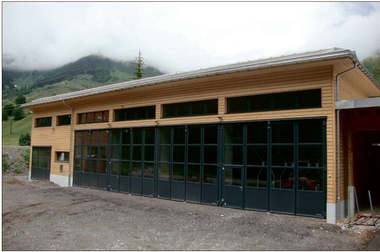
Il niv luvratori communal dalla vischnaunca da Tujetsch.

La vischnaunca ei sefatschentada igl onn vargau da differents projects pli gronds. Aschia ha ella tschentau ils binaris per la realisaziun dalla Residenza Dulezi, in baghetg cun habitaziuns per persunas sils onns. Cun desiderer han biaras e biars spitgual sin l'avertura dalla nova halla plurivalenta a Sedrun la fin digl onn. Suenter in liung temps da reponderaziun e planisaziun ha quella saviu vegnir