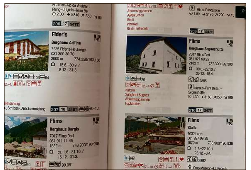
Cul guid «Berg-Beizli-Führer» pon viandonts e bikers planisar tgei ustrias ch'ei san visitar duront lur excursiuns.

Il cudesch «Berg-Beizli-Führer» (ISBN-Nr. 978-3-9524943-0-1) cuosta 39 francs ed ins sa cumpar el en kioscs, shops da suvenirs ed era en biaras ustrias ch'ei d'anflar el guid. Empustar el pon ins tier: Verlag Spillmann www.bergbeizli.ch